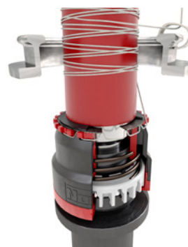
Установлена пустая трубка, пряжа зажата, запуск веретена.