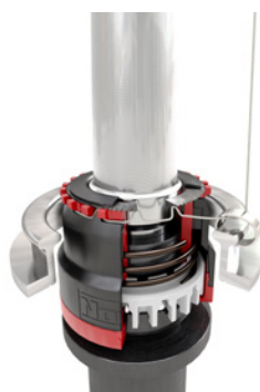
Веретено остановлено, пряжа зажата, початок снят, пряжа обрезана.