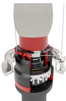
Початок завершен, обратная намотка, пряжа вставлена.