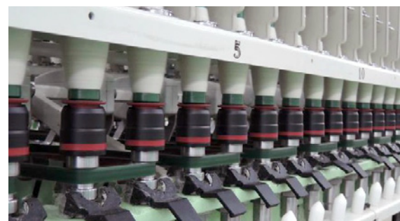
коронки, не требующие подмотки