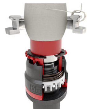
Прядение, пряжа отпущена, конец нити вылетает из системы.